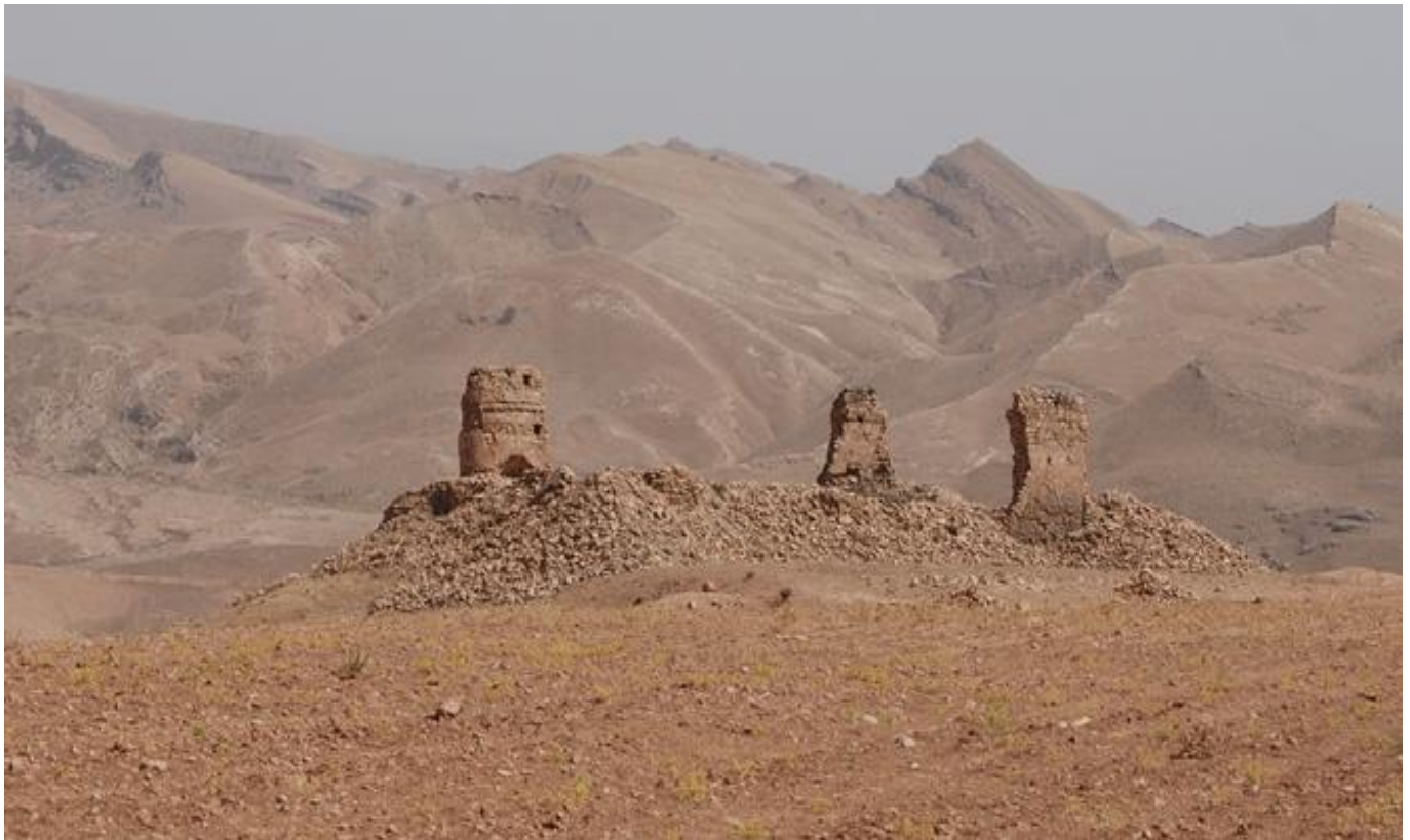
Paysage du Kurdistan irakien