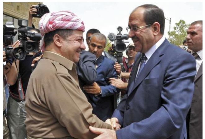
Massoud Barzani (gauche) et Nouri al-Maliki (droite)

L'autre dossier conflictuel concerne la constitution. Plusieurs demandent la réécriture de certains articles pour plus de pouvoirs en faveur du gouvernement central. Les opposants à la constitution la considèrent même comme la voie vers la sécession, alors que d'autres soutiennent qu'elle n'était valide que pour la période suivant l'invasion. Pour les Kurdes, la constitution telle qu'elle est constituée déjà un compromis. Barzani, qui dénonce les propos de Maliki et l'accuse même de vouloir ramener la dictature, trouverait inacceptable tout amendement qui diminuerait le pouvoir du Kurdistan 15 .