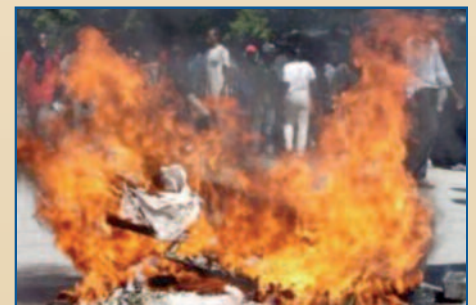
Manifestation contre la présence des Casques bleus le 18 novembre 2010 à Port-au-Prince

En troisième lieu, la difficulté des forces internes à garantir la sécurité humaine en Haïti laisse des incertitudes quant à une sortie de crise. En effet, la situation sécuritaire est aggravée par les conditions de fonctionnement de la police nationale haïtienne et de la Mission des Nations Unies pour la Stabilisation en Haïti (MINUSTAH) devant affronter les défis sécuritaires : appréhender les évadés de prison, les agresseurs des femmes et des enfants, les trafiquants de drogue. Avec une police mal équipée, surtout dans les circonstances post-séisme, la sécurité humaine sous les tentes est encore plus fragilisée. À cela, s'ajoutent des cas d'assassinat, des manifestations contre la MINUSTAH, accusée d'introduire l'épidémie de choléra dans le pays, et contre les dirigeants, en raison de leur impopularité et de la lenteur du processus de reconstruction, des manifestations souvent marquées de violences exercées aussi bien par les manifestants que par les forces de l'ordre qui ripostent. C'est dire que