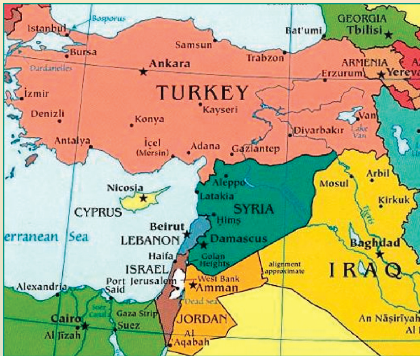
Carte du Moyen-Orient